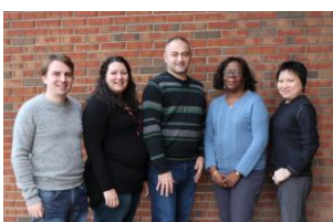
Équipe de la permanence

Depuis deux ans, l'échéance prochaine de notre entente de partenariat de dix ans avec la Société pour les enfants handicapés du Québec (SEHQ) est au cœur de nos préoccupations. Grâce au travail inlassable du comité de relocalisation, nous avons étudié 17 options pour finalement retenir une offre de location du domaine du Lac Bleu, propriété du Club des familles de demain, où nous emménagerons les répits en septembre prochain.