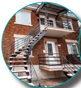
1862, rue Jolicoeur à Ville-Émard

2016 une nouvelle adresse et un nouveau camp!