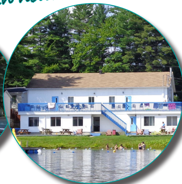
Domaine du Lac Bleu à St-Hippolyte